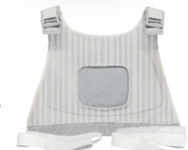
Rem för övre delen av ryggen En storlek passar alla