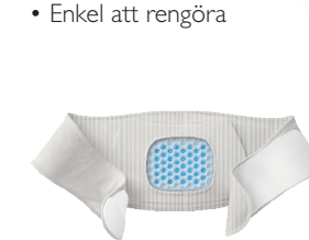
Rem för nedre delen av ryggen En storlek passar alla